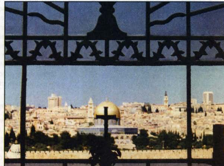
Udblik over Jerusalem fra Dominus Flevit – stedet, hvor Jesus ifølge traditionen græd over Jerusalem.

I evangelisk prædiken-tradition bruges teksten da heller ikke kun til at tale om dommen over Israel eller Jerusalem. I en prædiken af Luther fra 1525 bliver dommen over Jerusalem brugt som advarende eksempel om Tyskland,