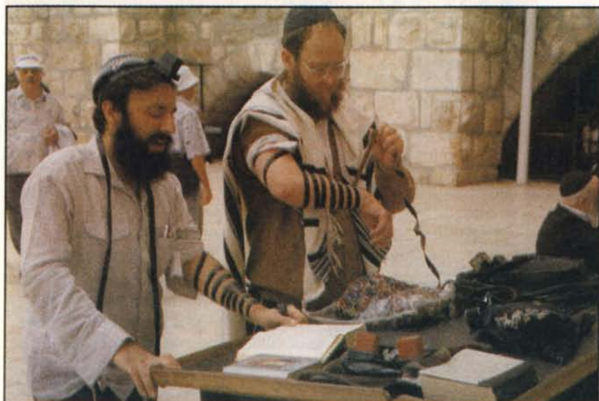
Den ene har bederem på sin venstre overarm, den anden er i færd med at anlægge den på sin højre overarm. Hvorfor? I artiklen gives et svar herpå.