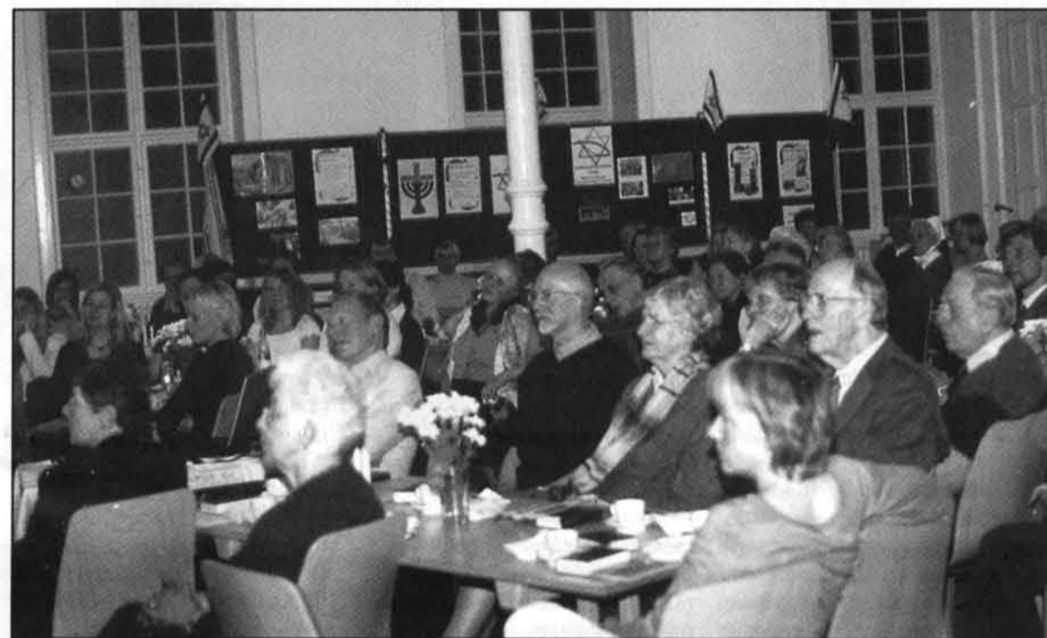
Op til omkring 150 venner af Israelsmissionen deltog i årsmødet