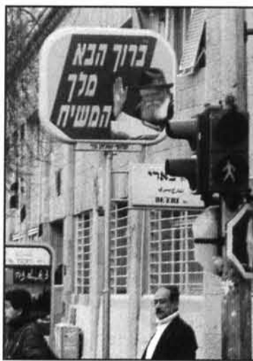
"Velkommen Kong Messias" – Jerusalem december 1992