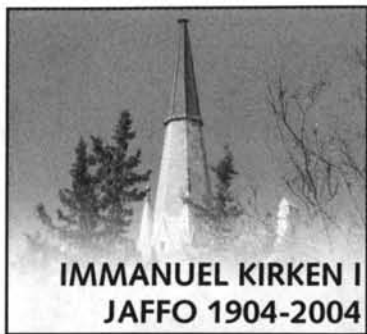
IMMANUEL KIRKEN I JAFFO 1904-2004

NÅR EN KONCERT ER I GANG I IMMANUEL KIRKEN, SIDDER TILHØRERNE VENDT MOD ALTERET OG KAN IKKE UNDGÅ AT LÆSE JOHANNES 3,16 – DEN LILLE BIBEL – PÅ HEBRAISK