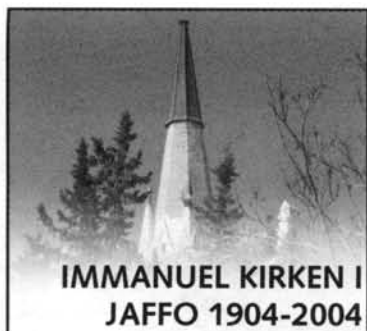
IMMANUEL KIRKEN I JAFFO 1904-2004

IMMANUEL KIRKEN ER DEN ENESTE PROTESTANTISKE KIRKE I TEL AVIV-OMRÅDET. "KIRKE" FORSTÅET SOM KIRKEBYGNING. I DENNE KIRKE SAMT DET NÆRLIGGENDE MENIGHEDSHUS HOLDER FORSKELLIGE MENIGHEDER DERES GUDSTJENESTER.