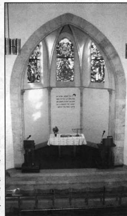
Immanuel Kirkens indre fik et nyt udseende i 1977.

samarbejde med dem ud over med den ghanesiske menighed. Men det er ikke let at finde lokaler her i området, hvor man kan samles til gudstjeneste. Især ikke hvis man økonomisk kun har begrænsede muligheder for at leje sig ind. De grupper, som bruger vores lokaler, betaler kun et lille beløb, men vi er glade for at kunne hjælpe dem til et sted at samles og et sted at bede, noget som de har brug for