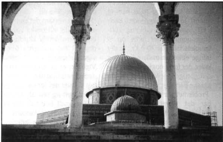
Omarmoskeen eller Klippemoskeen som dominerer Jerusalems bybillede – er efter Mekka og Medina det tredje helligste sted i verden for muslimer.

til dialog mellem verdensreligionerne i bestræbelserne på at skabe fred og forsoning mellem de stridende parter i Mellemøsten.