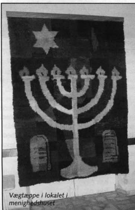
Vægtæppe i lokalet i menighetshuset

og er glade for. Hvis det, vi har at forvalte her, kan bruges som et bedehus for andre folk, så løser vi også noget af den opgave, som vi har.