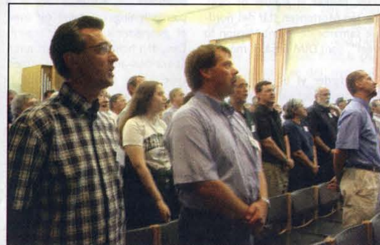
I LCJE er vi mange, der står sammen om mission til det jødiske folk

I år har vi imidlertid opsagt vort medlemskab af LEKKJ. Og med beklagelse. LEKKJ blev nemlig